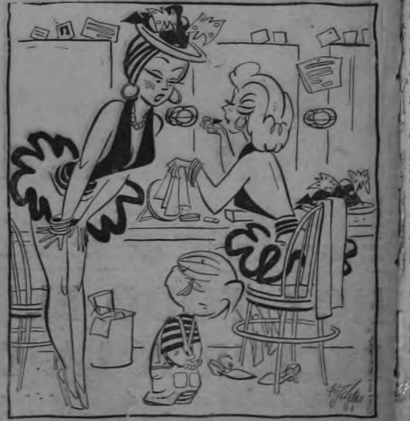
¿Te envió tu padre aquí para tener la excusa de venir a buscarte?