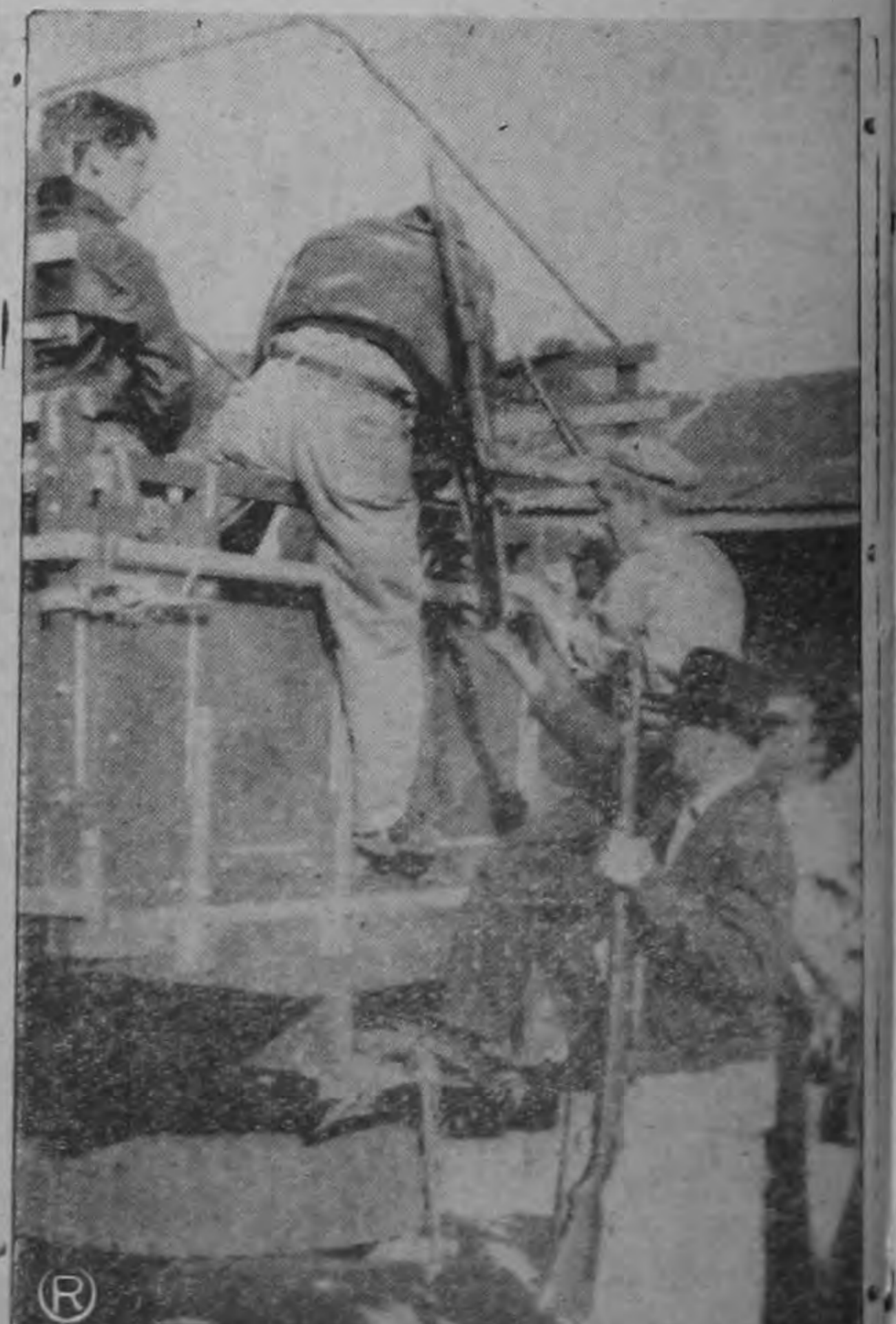
Voluntarios civiles de Zarcero suben en un camión para dirigirse a combatir a los agresores.