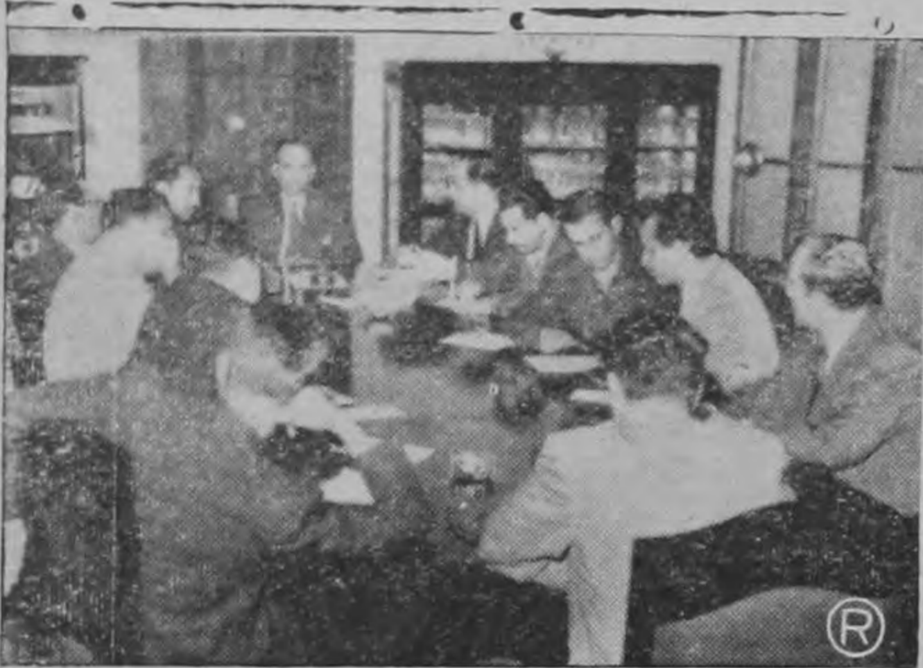
JUNTA DE GOBIERNO. — Los miembros de la Junta de Gobierno sesionan en pleno a fin de tomar las medidas pertinentes para controlar el brote revolucionario.