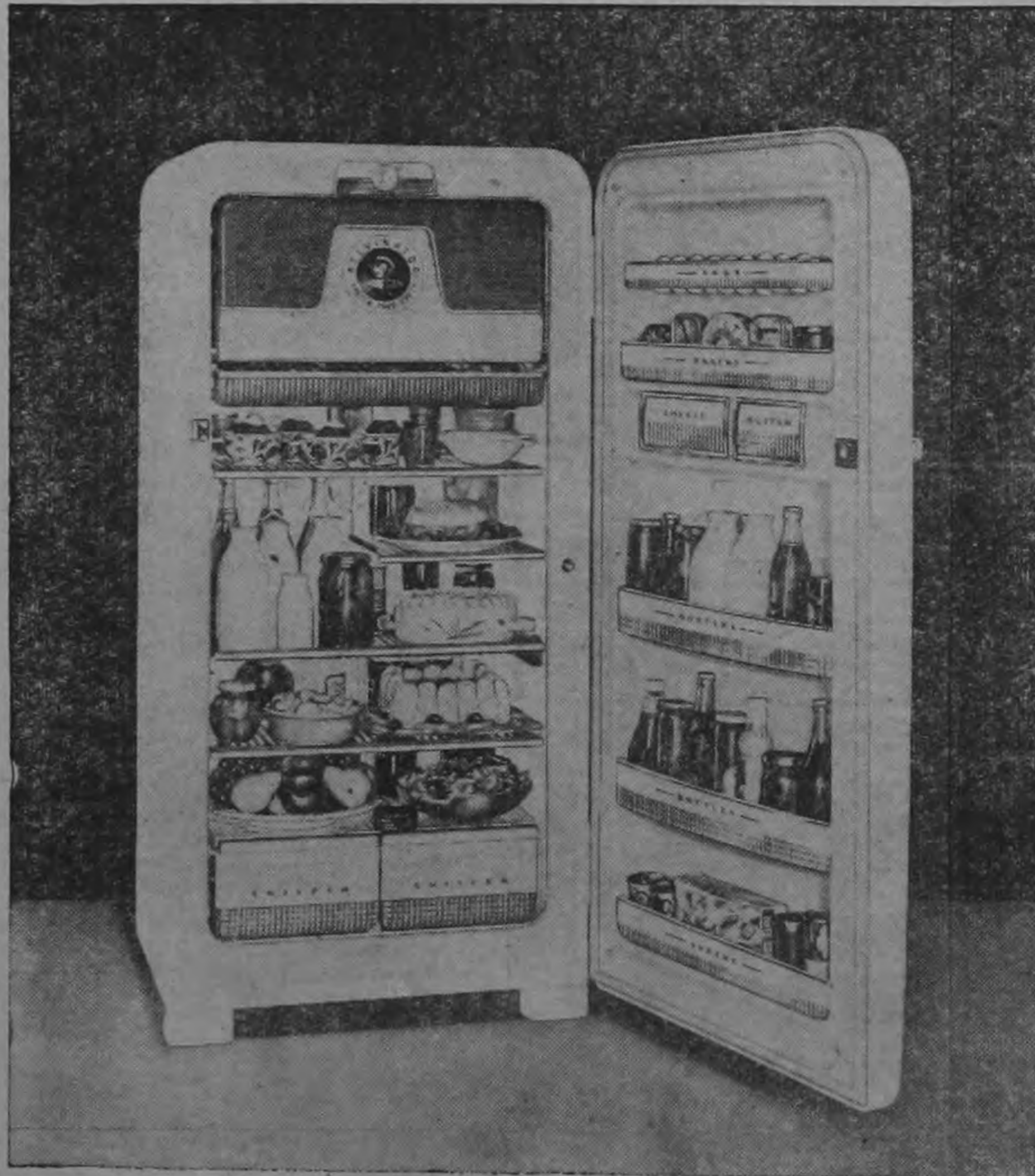
Fué el primero (1914)... y continúa EN PRIMERA LINEA!

MUCHO MAYOR ESPACIO... LUJOSAMENTE DECORADO...!