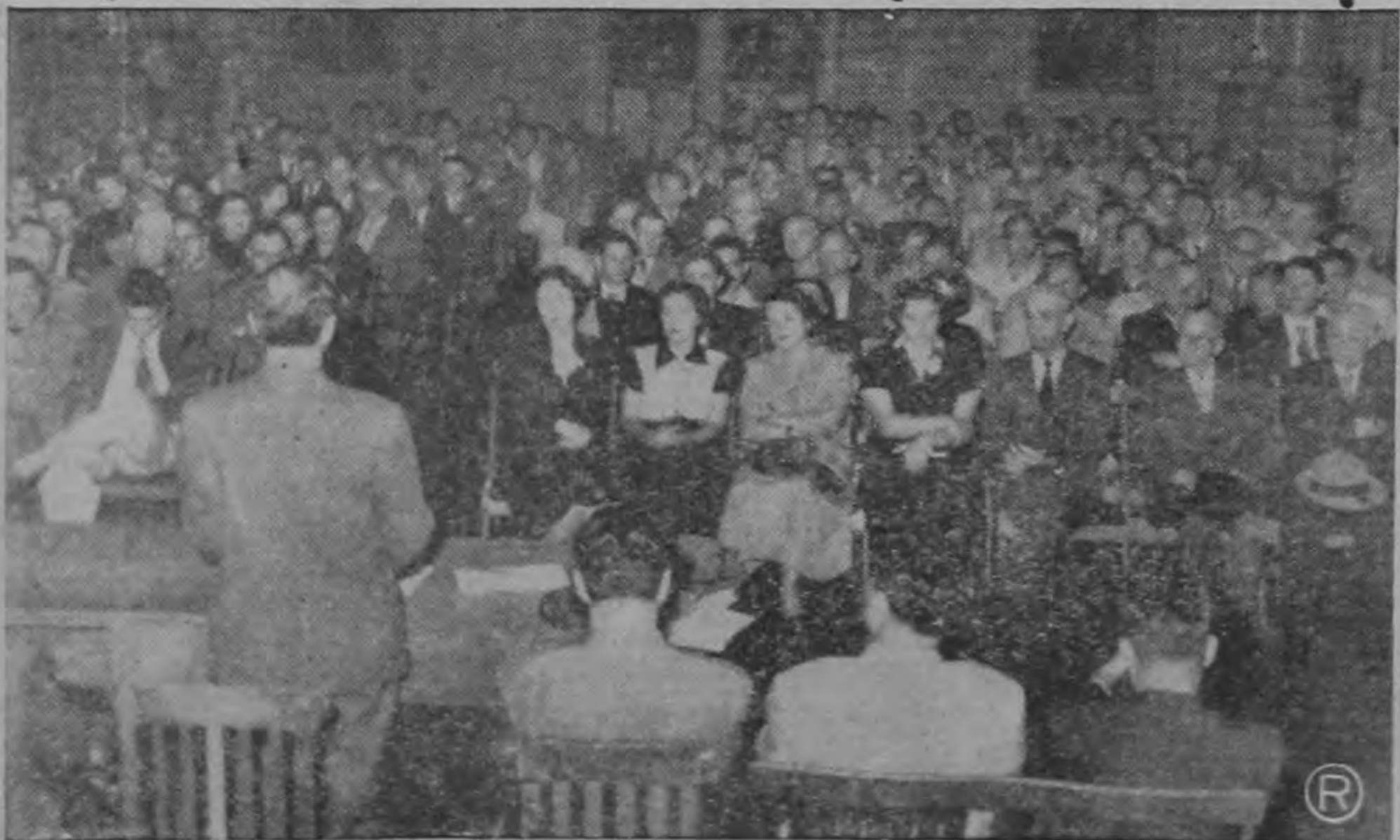
JUNTA DE CIUDADANOS EN EL EDIFICIO METALICO. — Ayer a las 5 p.m., convocada por el Comité de Defensa Civil, se verificó una Junta de Ciudadanos en el Edificio Metálico. Las fotos muestran al señor Presidente Figueres dirigiéndose a la concurrencia.